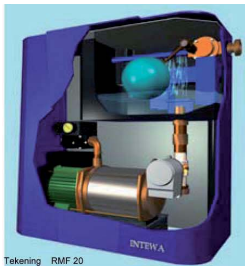
Tekening RMF 20