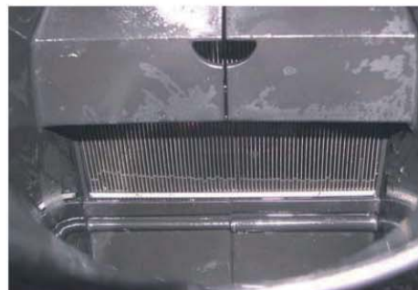
Gereinigde achterzijde van de filter na het gebruik gedurende enkele seconden van een hogedrukreiniger