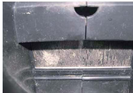
Achterzijde van een vervuilde filter